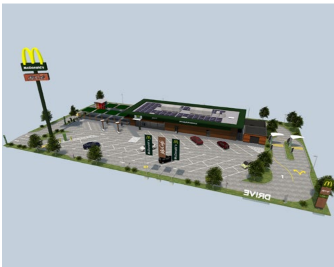
Blick von der Römerallee auf die neue McDonald's-Filiale in Zülpich: Die Eröffnung des Schnellrestaurants ist für Herbst 2023 geplant.

Die Eröffnung des McDonald's-Restaurants in Zülpich ist bereits für Herbst 2023 geplant.