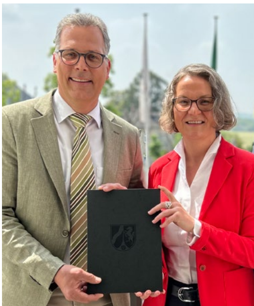
Ina Scharrenbach, Ministerin für Heimat, Kommunales, Bauen und Digitalisierung des Landes NRW, übergab den Bewilligungsbescheid für die Wiederaufbaupläne der Stadt Zülpich an Bürgermeister Ulf Hürtgen.

Nach Angaben des Ministeriums sind aus dem Stadtgebiet Zülpich insgesamt 430 Anträge auf Wiederaufbauhilfe von Privatpersonen und Unternehmen über das Online-Förderportal des Landes NRW eingegangen. Deren Gesamtvolumen beläuft sich auf rund 13,1 Millionen Euro. Von diesen 430 Anträgen befinden sich 409 Anträge im Bewilligungsprozess. Ministerin Scharrenbach wies in diesem Zusammenhang darauf hin, dass die Antragsfrist, die eigentlich am 30. Juni 2023 endet, in Kürze auf den 30. Juni 2026 und die Bewilligungsfrist auf den 31. Dezember 2030 verlängert wird. Der lange Zeitraum zeigt, dass sich die Beseitigung der Flutschäden nicht von heute auf morgen bewerkstelligen lässt. Das ist auch Bürgermeister Ulf Hürtgen bewusst: „Es hat sich schon Vieles getan, aber es ist auch noch eine Menge zu tun.“