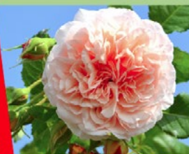
"Rose de Tolbiac" unsere Zülpichrose

Wir bieten Ihnen 6.000 Rosen in 75 Sorten aus eigener, regionaler Anzucht