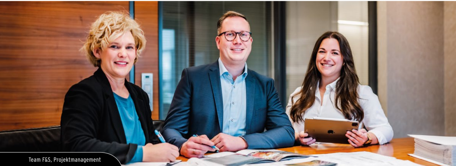
Team F&S, Projektmanagement